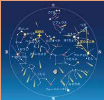
8月13日02時30分頃の星空

今年は月が沈む12日午後11時ごろから13日未明にかけて20個/時ほどの流星を見ることができます。